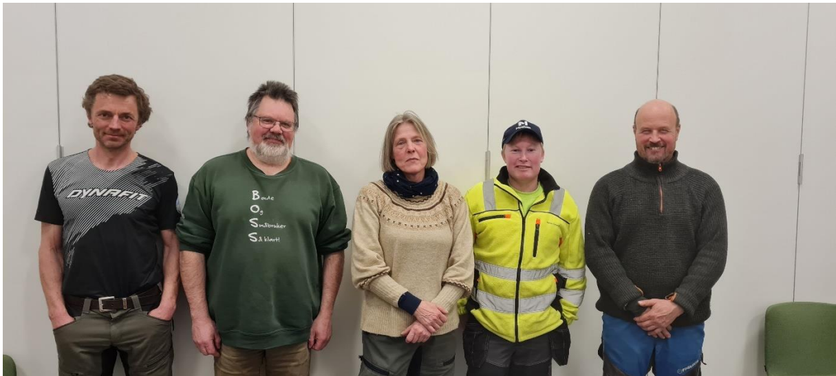
Styret i Oppland Bonde- og Småbrukarlag 2023/2024

Med hilsen styret i Oppland Bonde- og Småbrukarlag