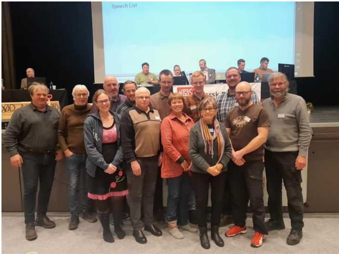
"Hedmarksbenken" under landsmøtet 2023.