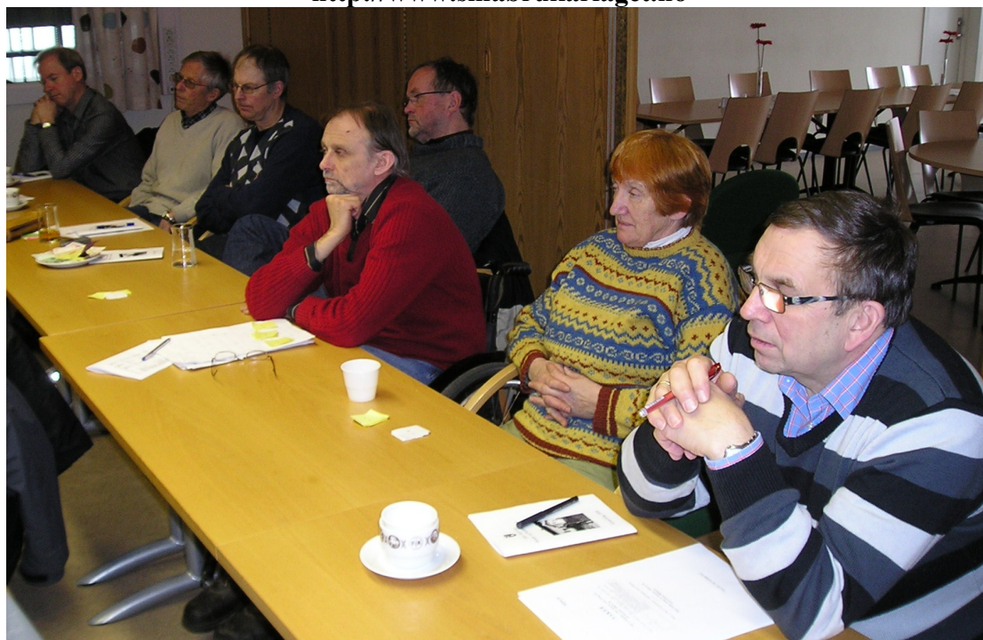
Fra årsmøte 7.mars 2009