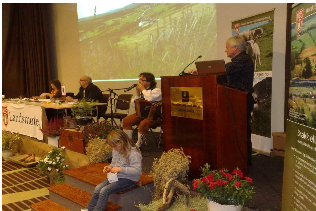
Bilde er fra åpningen av landsmøte i NBS.

Elles deltok vi med Honning som “Smaken fra fylket” og lokalproduserte produkter fra fylket. Vi stod også for pynting av landsmøte salen og fikk hjelp fra skolebarn fra Sørkedalen med fine tegninger.