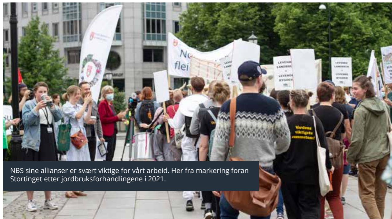
NBS sine allianser er svært viktige for vårt arbeid. Her fra markering foran Stortinget etter jordbruksforhandlingene i 2021.

Våre samarbeidspartnere og allianser er viktig for Norsk Bonde- og Småbrukarlag. De gir oss faglig tyngde, lar oss jobbe med en bredde av saker og gjør oss sterkere i møte med politikere. Vi oppnår mest når vi står sammen med andre!