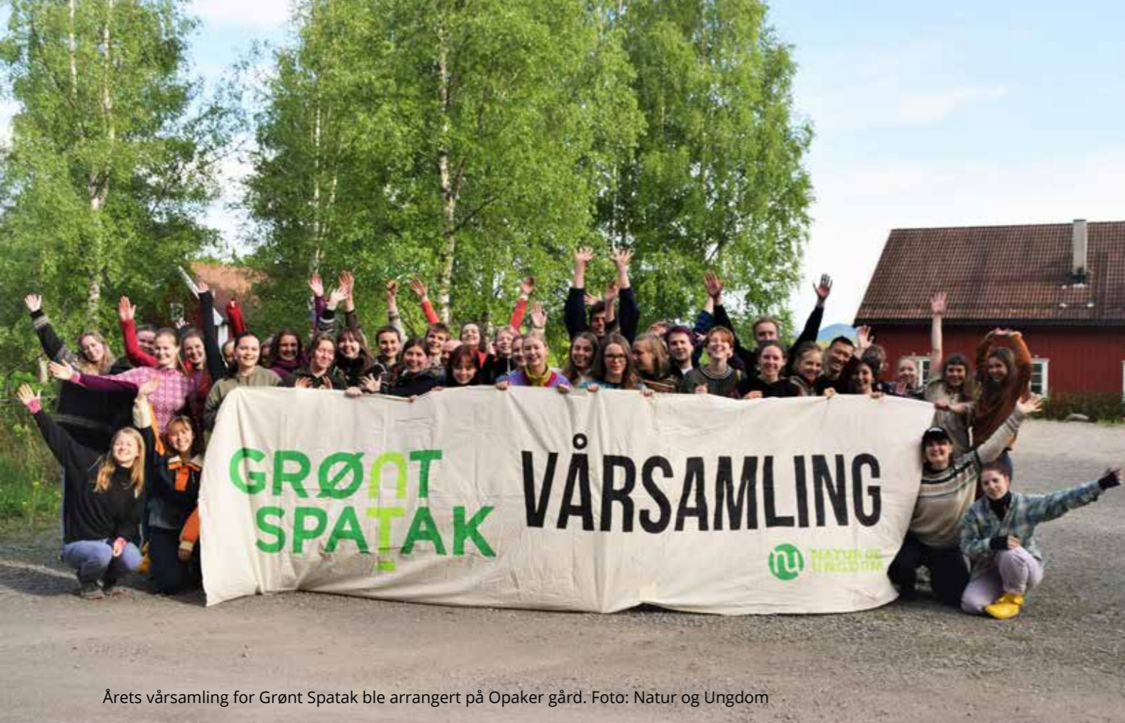
Årets vårsamling for Grønt Spatak ble arrangert på Opaker gård.

I tillegg til lav deltakelse, slet prosjektet med 17 avmeldinger etter påmeldingsfristen. Som i fjor ble det sendt ut et skjema for å høre om grunner til avmelding, men ingen har svart. Tiltakene som ble prøvd ut for å hindre avmeldinger i år ser ikke ut til å ha hindret avmeldinger. Derfor må vi i løpet av høsten se på andre tiltak som kan hindre avmeldinger. Neste år er Grønt Spatak 30 år og fram til da vil økt synlighet være mest i fokus.