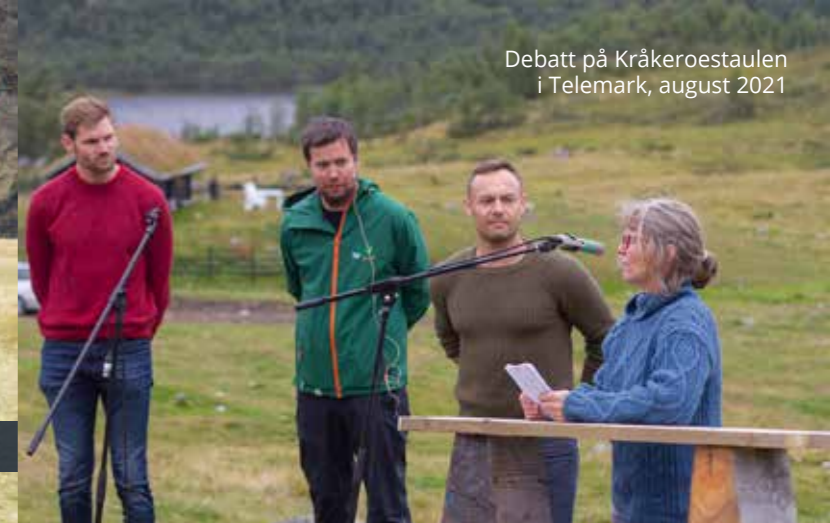
Debatt på Kråkerostaulen i Telemark, august 2021