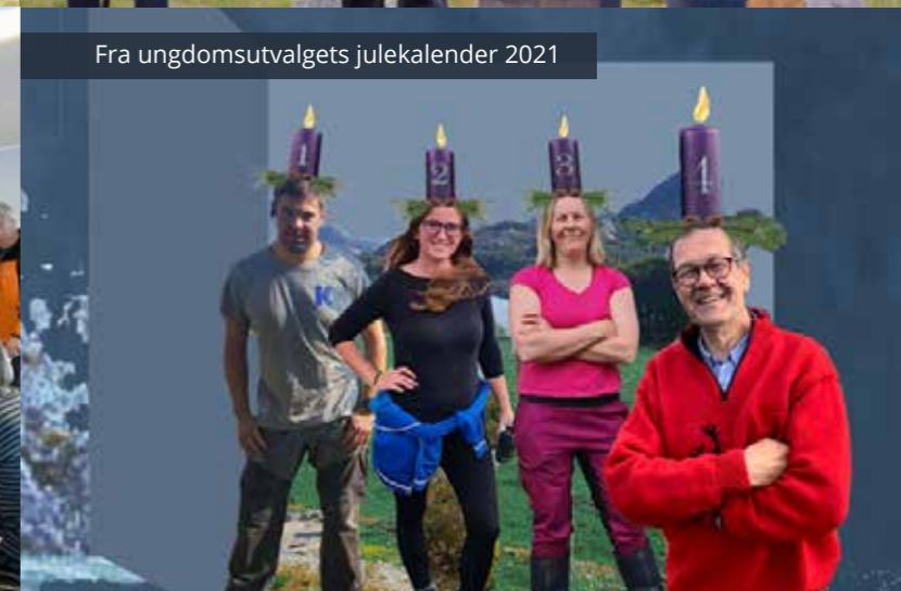
Fra ungdomsutvalgets julekalender 2021

Etter halvannet år med pandemi kunne organisasjonen endelig møtes fysisk igjen. Det har laget utnyttet godt, med landsmøte på Gardermoen, politisk debatt på Kråkeroe-staulen i forkant av valget, stands og messedeltakelse over hele landet og et vellykket ungdomsseminar i mars.