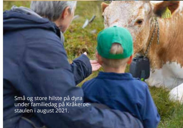
Små og store hilste på dyra under familiedag på Kråkeroe-staulen i august 2021.