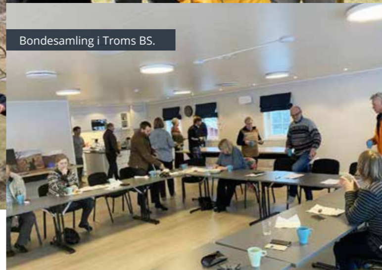
Bondesamling i Troms BS.