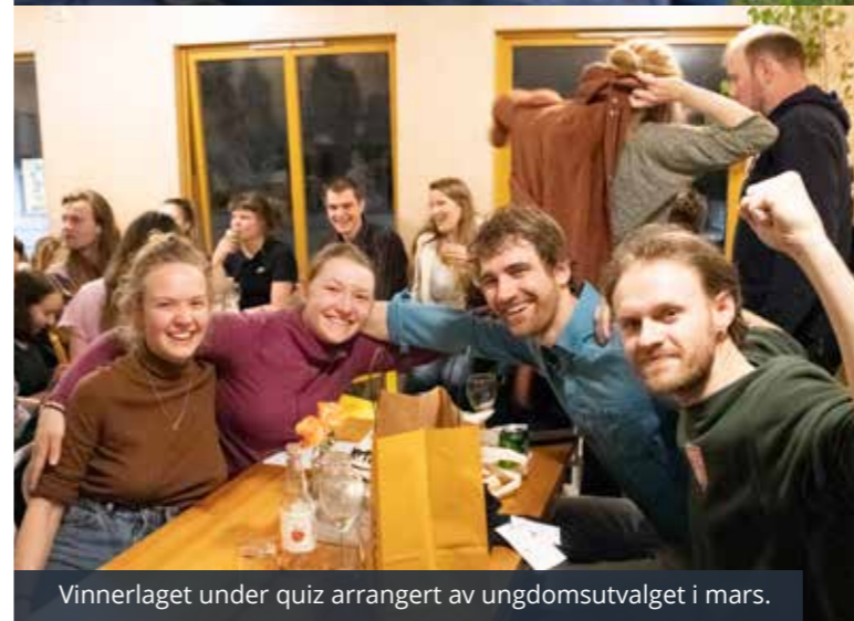
Vinnerlaget under quiz arrangert av ungdomsutvalget i mars.