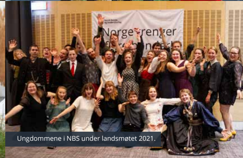
Ungdommene i NBS under landsmøtet 2021.