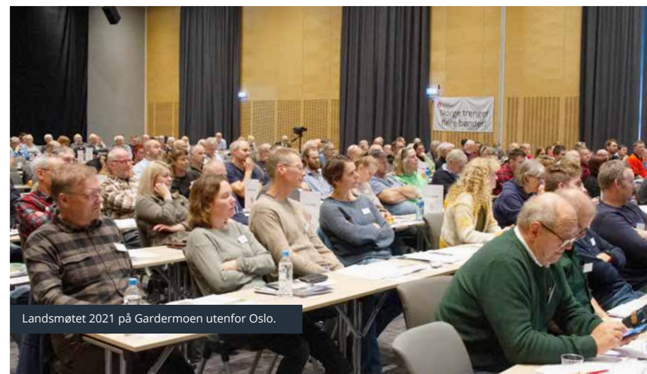
Landsmøtet 2021 på Gardermoen utenfor Oslo.

Organisasjonsarbeidet i Norsk Bonde- og Småbrukarlag har lenge vært preget av manglende ressurser og kapasitet. Med digitalisering, nyansettelser og omlegging av kommunikasjonsarbeidet, har utviklingsarbeidet i organisasjonen startet for fullt. Fremover vil omstilling av organisasjonsarbeidet være en viktig prioritet.