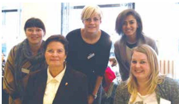
Bilde fra "Jakten på Kvinnebonden"-konferansen.