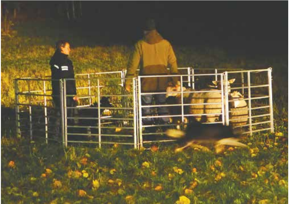
Gjetarhundtreningane er opne for alle og skaper samhold.