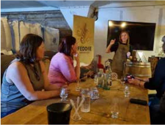
Spennande omvisning og prøvesmaking på Feddie Ocean Distillery.