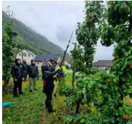
Demonstrasjon av tynningsvisp i plommefelt.