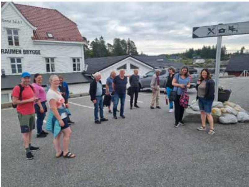
Kilstraumen Brygge. Ein triveleg plass å bu.