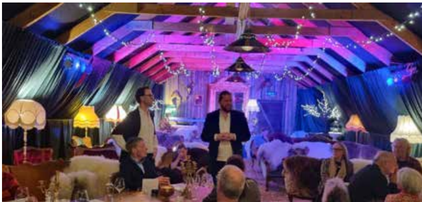
Årsmøtemiddag på Søvane Gard.