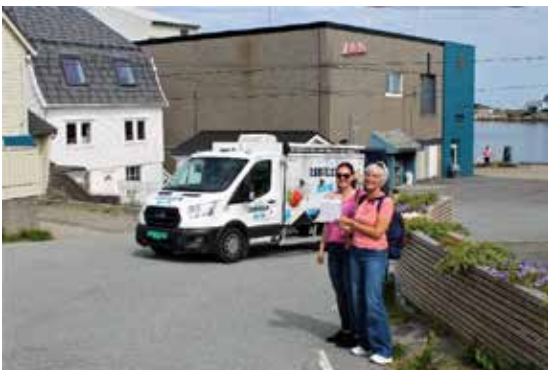
Isbilen svikta ikkje denne gongen heller.