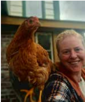
Nina i sitt rette element