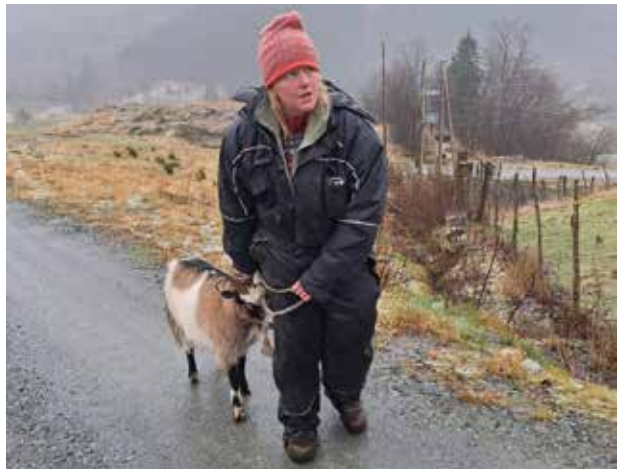
Nina og Hagenesa

Truleg vil dei seie at eg er sta, engasjert og alltid i gang med noko. Eg er ikkje den som pratar mest, men eg seier ifrå når eg meiner noko