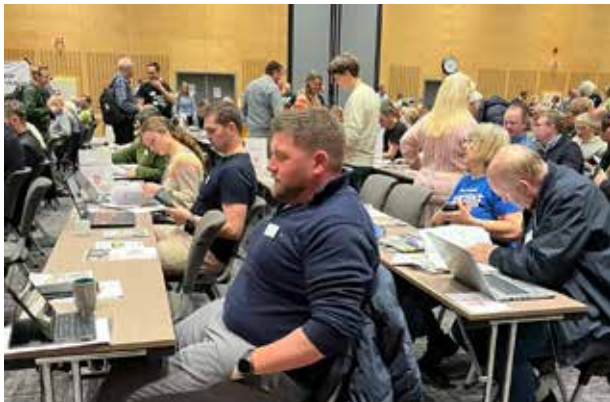
Utsendingane frå Sogn og Fj. BS

Det som slo meg mest var følelsen av at alle som ville si noe ble hørt og lyttet til. Selv om jeg ikke kjente noen andre som skulle på møtet ble jeg tatt veldig godt i mot synes absolutt at landsmøtet var et av høydepunktene den høsten.