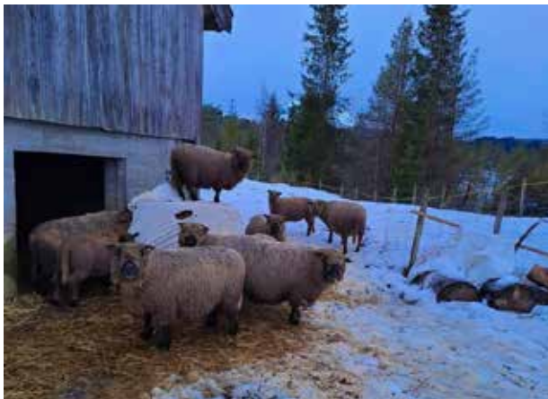
Sauer på Korshåjen gard