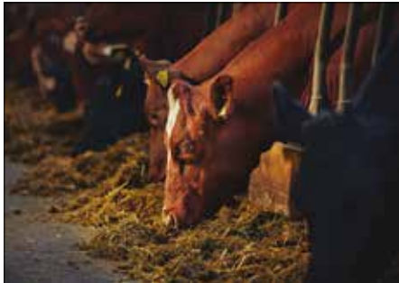
DRØV Serien til melkekyr og storfeoppdrett