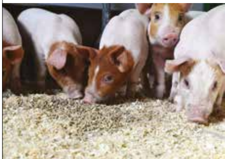
IDEAL Serien til purke, smågris og slaktegris