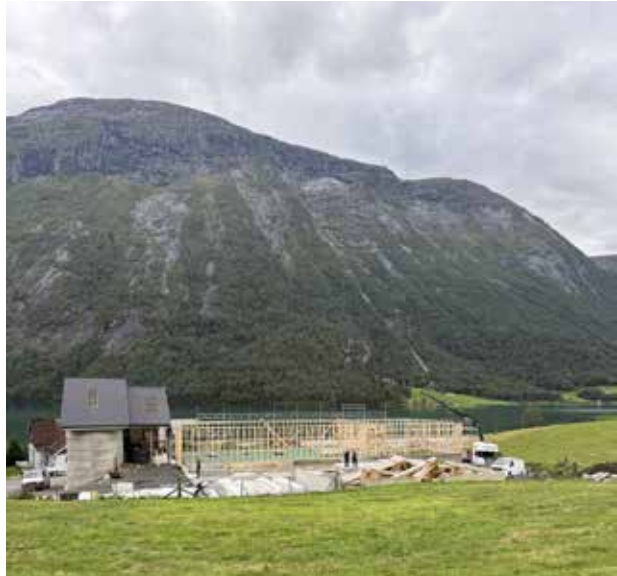
Ny driftsbygning under bygging