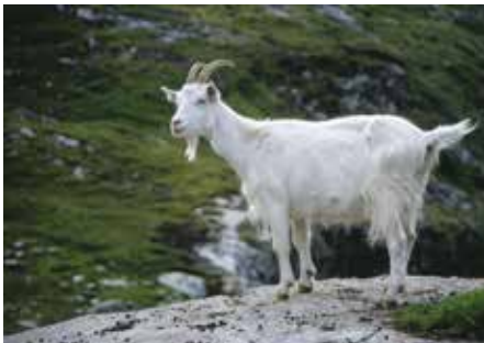
DRØV Serien til geit