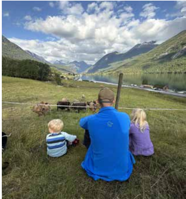
Glimt frå garden Tenden

Ein av dei største hobbyane er gardsdrift, og då som både dyrehald, maskiner og utstyr og ikkje minst brøyting på vinterstid. Det er sjølv sagt mindre tid til hobbyar no enn før