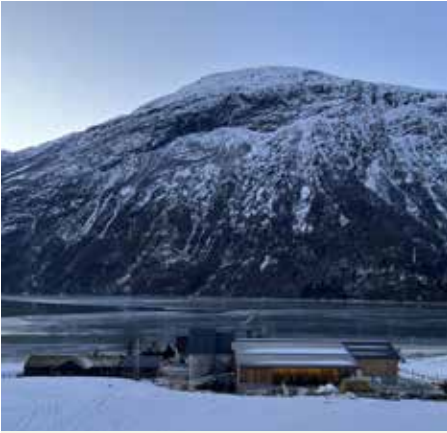
Driftsbygning slik han er no