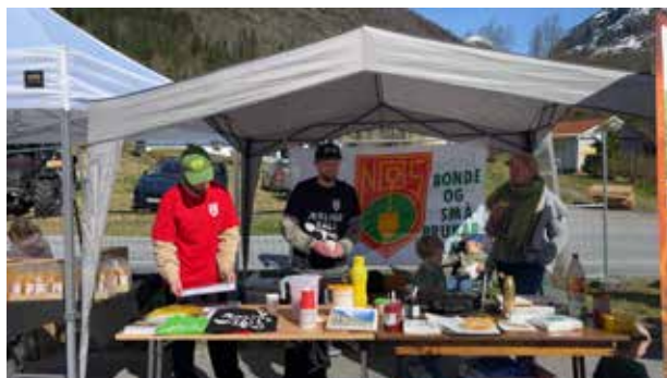
Stand på Bygdenæringsdagane i Stardalen

SFBS har starta arbeidet med oppattstarting av