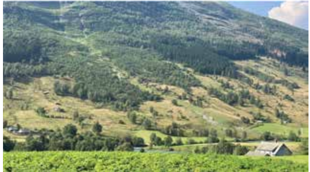
Skogen vår, som staten stjel forteneasta av.

Landsmøtet 2025 vart i år halde på Gardermoen. Eit stort og godt gjennomført landsmøte. Sogn og Fjordane hadde 10 utsendingar inkludert ein ungdomskandidat. Fleire av delegatane var også på talarstolen. I tillegg var fylkessekretær Karen