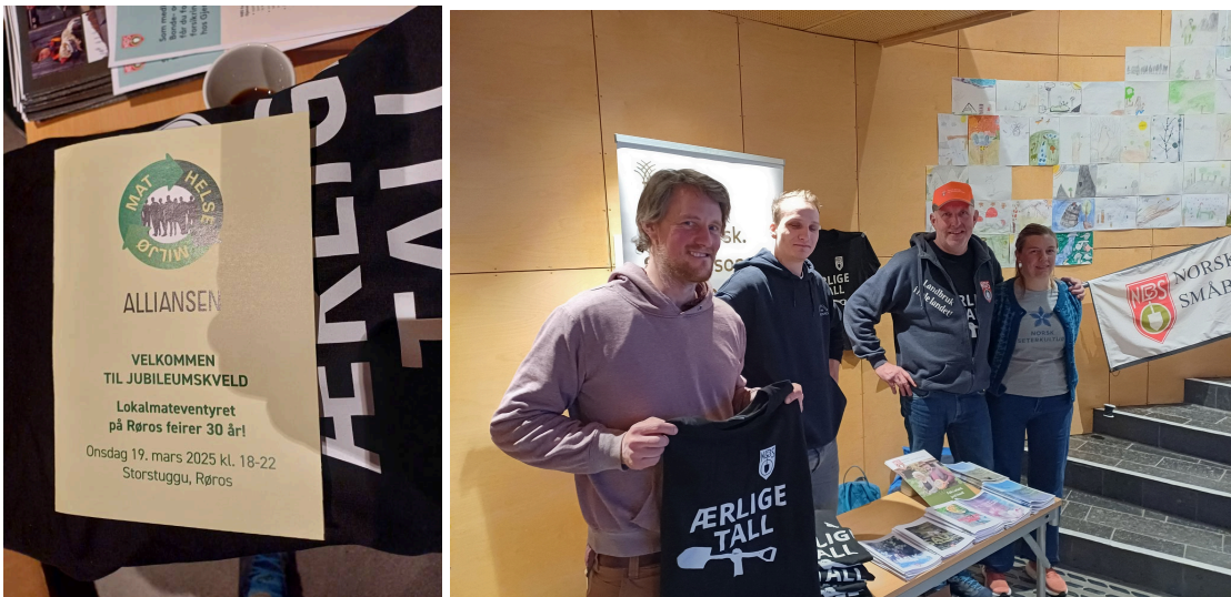
Tolga og Tynset BS bidro med stand og info.

Den 19. mars var det duket for 30-års jubileum i alliansen Mat, Helse, Miljø!