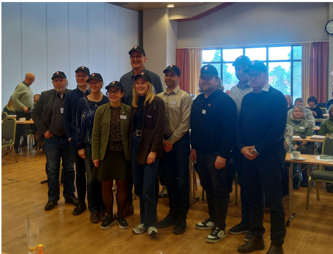
Politikerpanelet fikk tildelt snipphuver fra NBS