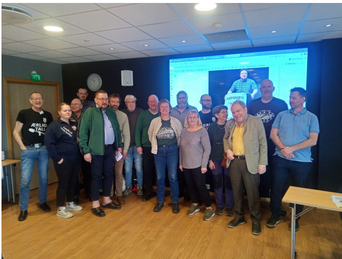
16 årsmøtedeltakerne fra Hedmark