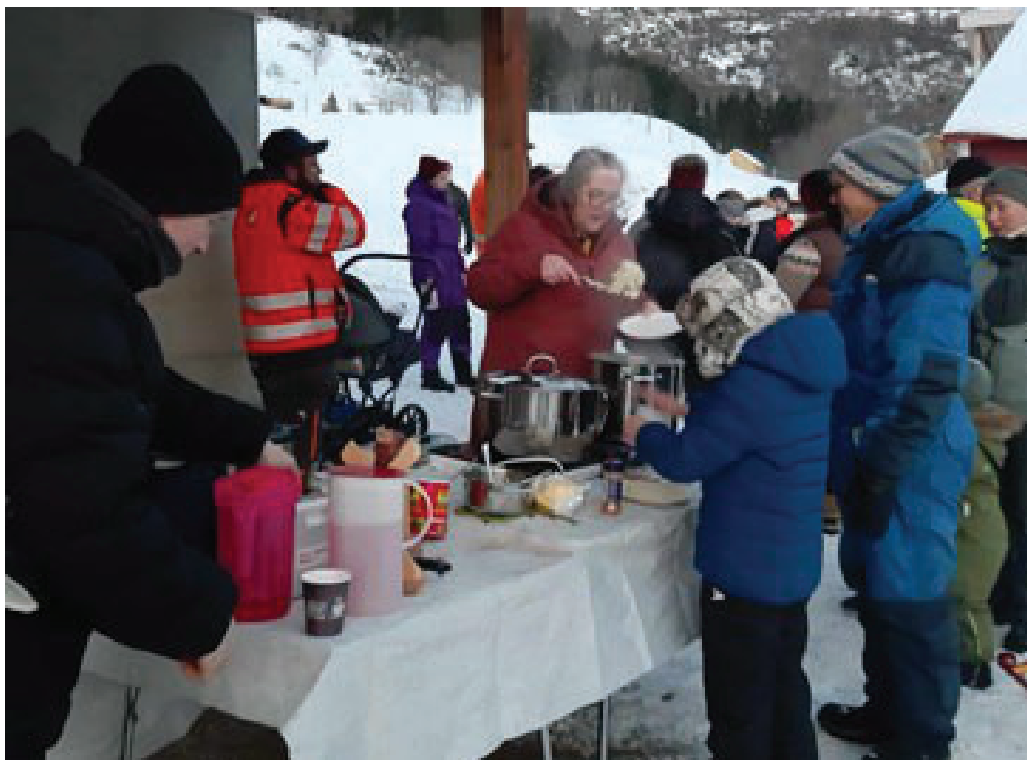
Det ble kø i grøtserveringa på Stormo gård

gård i Gratangen i begynnelsen av desember. Gårdsfolket kokte grøt og fyrte opp bålpanna, og folk strømmet til - både fra nabohus og fra andre kommuner. Rundt 100 personer var innom i løpet av et par timer! Vi gleder oss til fortsettelsen, og håper at både lokallag og enkeltbønder vil være med på dette prosjektet gjennom året som kommer!