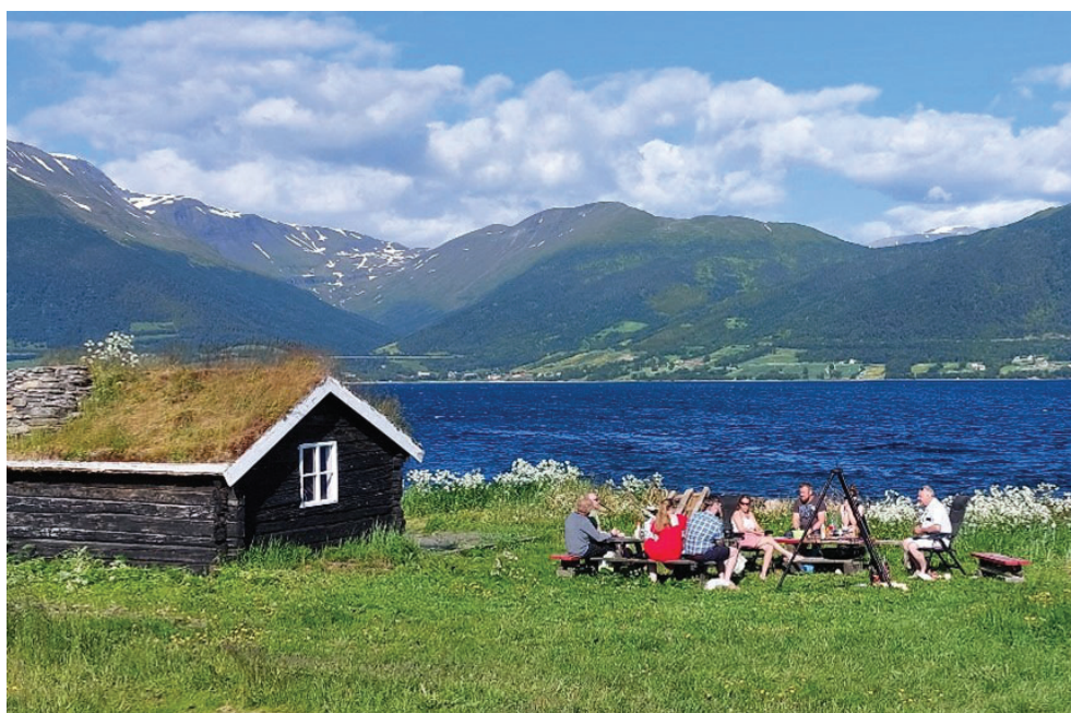
Forberedelser til grilling, på sommersamling

Balsfjord fikk imidlertid et annet arrangement, da vi la sommersamlinga til Tennes 1. juli. Her fikk vi omvisning i fjøsen på Slettmo, før vi rigget oss til med grillmat og bålpanne.