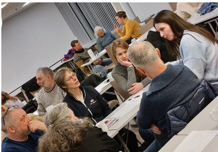
Politisk verksted i forbindelse med fylkesårsmøtet: Hvordan kan vi øke bruken av utmarksbeitene?