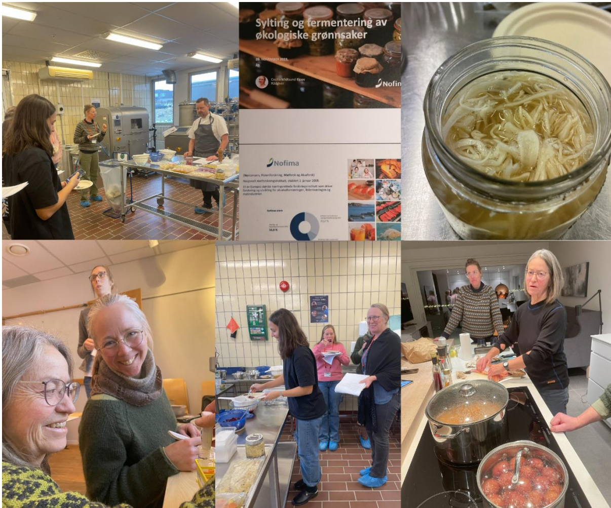
Kurs i sylting og fermentering av økologiske grønnsaker 2023, Nofima Ås