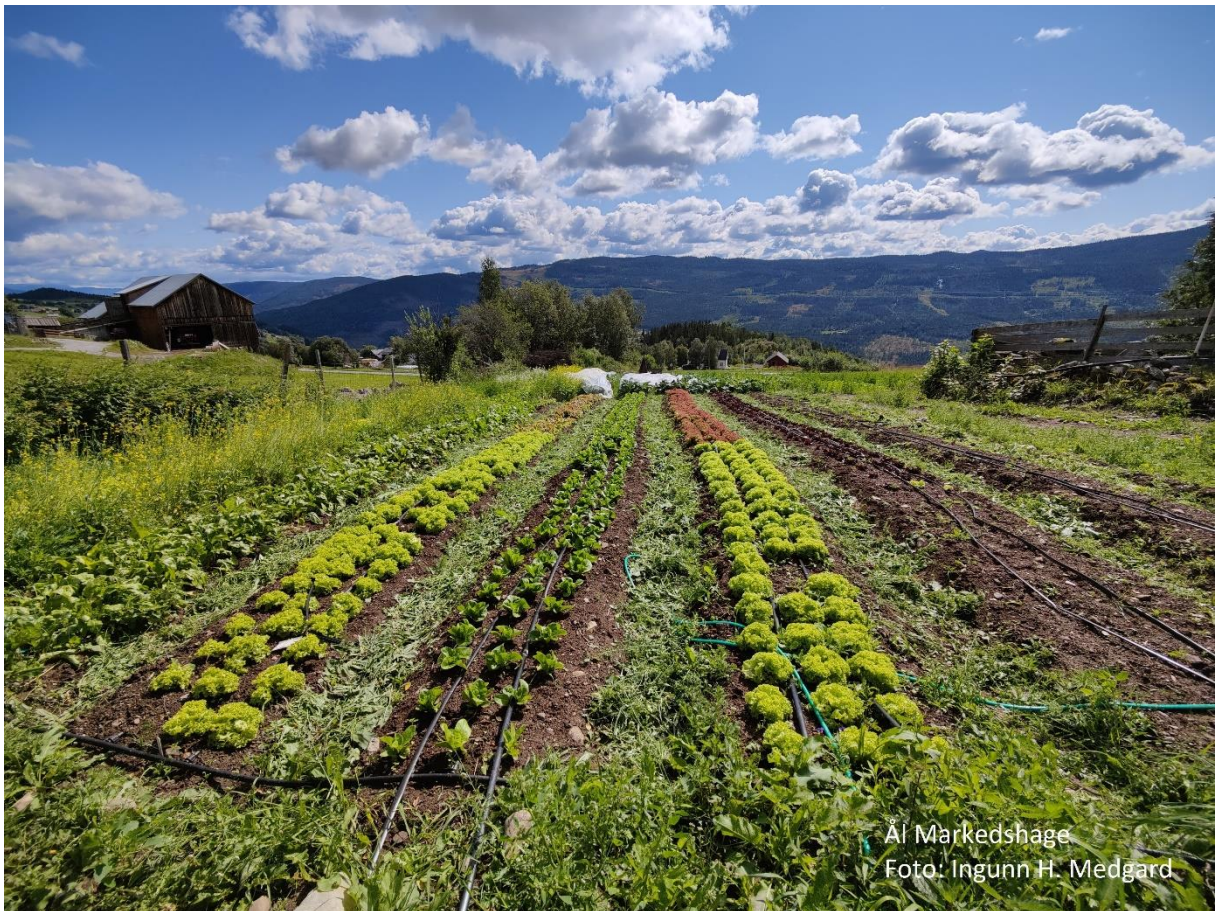
Ål Markedshage