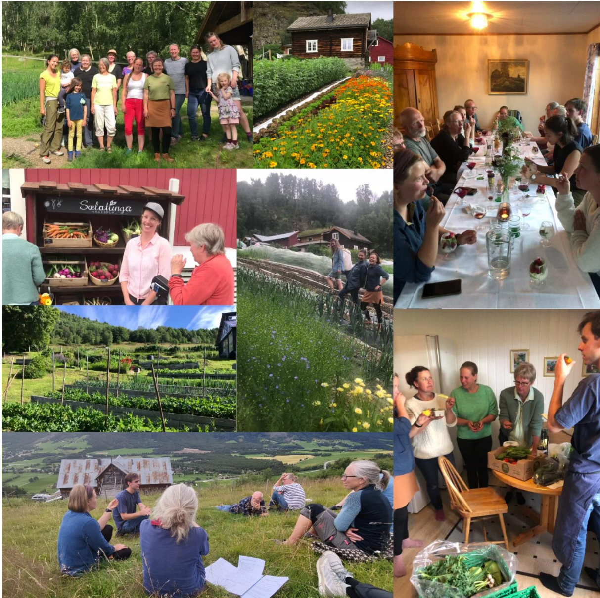
Studietur 2022 med besøk i tre markedshagar i Vågå, Dovre og Lesja

Morgonen etter hadde me open post der alle kunne koma med kva dei hadde behov for. Det var og sett av tid til informasjon om tips og triks for å gjera salg og rekneskap enkelt og oversikteleg som Rannei Hovde hadde for oss. Det var skrivi referat frå studieturen og det vart bruka som grunnlag for å planlegge nettverksamlinga i 2023.