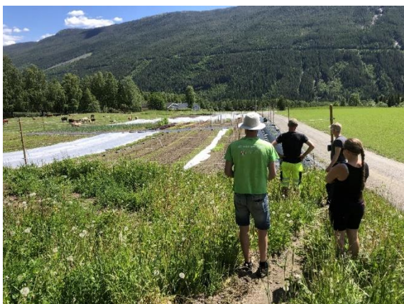
Markdag på Rudningen Gol, 2022